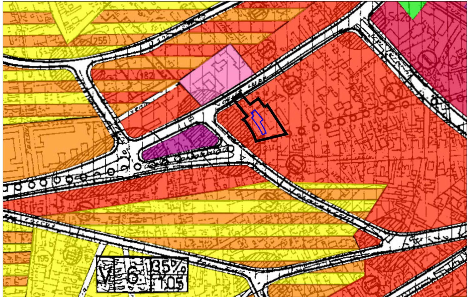
INCADRARE IN PUG 1:5000